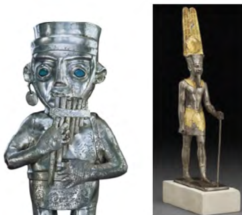
Figura 1: A la izquierda: Estatuilla chimú en plata y malaquita, S.XIV-S.XV, Museo Metropolitano, Nueva York. A la derecha: estatuilla de oro y plata de Amun-Ra de la dinastía XXVI (S.VI a.C.)

Pero no se trata solo de nombres. Mi elemento favorito resulta sumamente atractivo por el rol que ha ocupado a lo largo de la historia de la humanidad a partir de las múltiples funciones que adquirió; entre el momento de su descubrimiento, explotación e intercambio, con la aparición de las civilizaciones antiguas, hacia el año 3000 a.C., y el momento en que se completó el circuito del mercado mundial al quedar América y las islas del Pacífico incorporadas a él en el siglo XVI (Pastor, 2010). Funciones que, principalmente, se debían a dos cuestiones: monetaria y religiosa (figura 1).